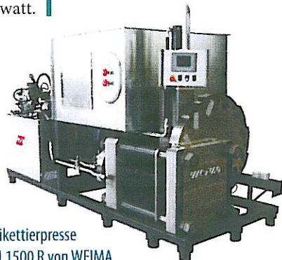
Brikettierpresse TH 1500 R von WEIMA

Das Material kann in einen großen Vorratsbehälter aufgegeben werden, aus dem es mittels Rührwerk und Austragungsschnecke dosiert der Pressenmechanik zugeführt wird. Die Pressung läuft dann in einer geschlossenen Matrize ab, wodurch sehr hohe Materialdichten erreicht werden können. Die Antriebsleistung der Brikettierpresse TH 1500 R von WEIMA beträgt 30 Kilowatt.